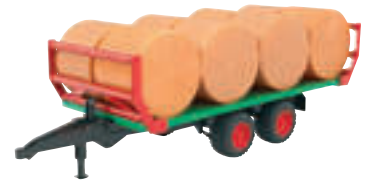
BALLENTTRANSPORTANHÄNGER MIT 8 RUNDBALLEN

- Für Kinder ab 3 Jahren - Maßstab 1:16 - L x B x H (cm): 44 x 15,5 x 15,5