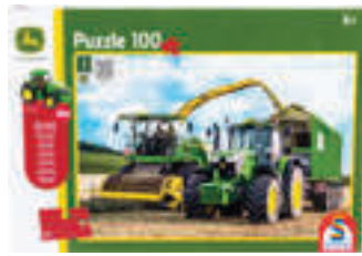
PUZZLE 6195M MIT ERNTEMASCHINE 100 Teile