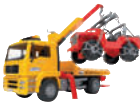
MAN TGA ABSCHLEPP-LKW MIT GELÄNDEWAGEN

- Für Kinder ab 4 Jahren - Maßstab 1:16 - L x B x H (cm): 49,5 x 18,5 x 25,5