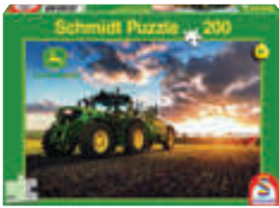
PUZZLE JOHN DEERE 6150R 200 Teile