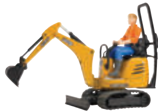
JCB MIKROBAGGER MIT ARBEITER

- Für Kinder ab 3 Jahren - Maßstab 1:16 - L x B x H (cm): 13,5 x 6,3 x 13,5