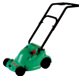
RASENMÄHER BOSCH ROTAK